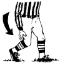
Blocage par derrière Taper l'arrière des genoux avec les mains