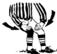
Blocage en dessous de la ceinture Frapper les genoux avec les poings