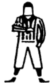
Passe Hors-jeu Décrire un arc horizontal avec l'avant-bras replié