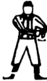
Bloc de la tête / Plaqué de la tête Frapper la paume d'une main avec le poing