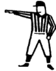
Rudesse Un bras ou l'autre tendu de côté