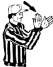
Rudesse excessive et disqualification Trancher le poignet gauche