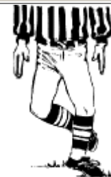
Trébucher Croisement d'un pied devant l'autre