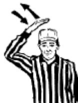
Substitution illégale Taper le dessus de la tête avec la main