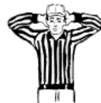
Équipement non réglementaire Les deux mains derrière la tête