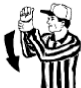
Utilisation défendue des mains Saisir un poignet à la hauteur du visage