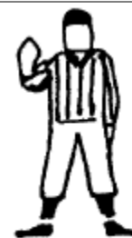
Contact illégal sur un receveur Un bras tendu vers l'avant avec la main ouverte