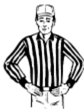
Hors jeu Main sur les hanches