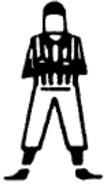
Zone d'immunité (no yards) Bras croisés