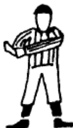
Blocage illégal Saisir un poignet et pousser vers l'avant