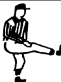
Contact avec le botteur Lever et toucher le bas d'une jambe