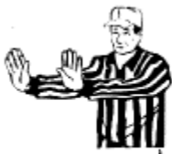
Obstruction sur une passe (Passe moins de 15 verges) Geste de poussée des 2 mains vers l'avant à la hauteur des épaules