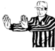
Obstruction sur une passe (Passe plus de 15 verges) Geste de poussée des 2 mains vers l'avant à la hauteur des épaules