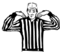
Receveur non autorisé au-delà la ligne de mêlée Toucher les épaules avec les mains