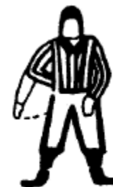
Conduite répréhensible Agiter une main derrière le dos