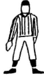
Blocage surprise illégal Frappe de la hanche avec une main ouverte