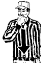
Saisir le protecteur facial Imitation du geste du joueur