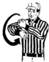
Procédure illégale Rotation des mains devant la poitrine